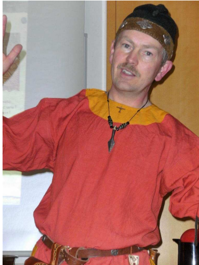
Team Wuppertal: Projekt Frankenzeit